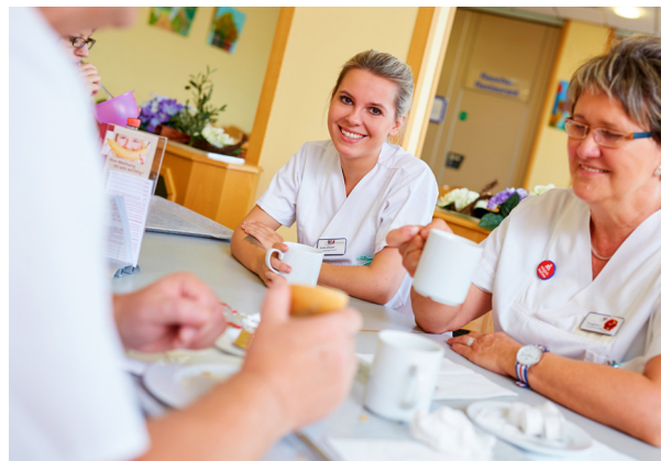
Zusammenarbeit team- und abteilungsübergreifend