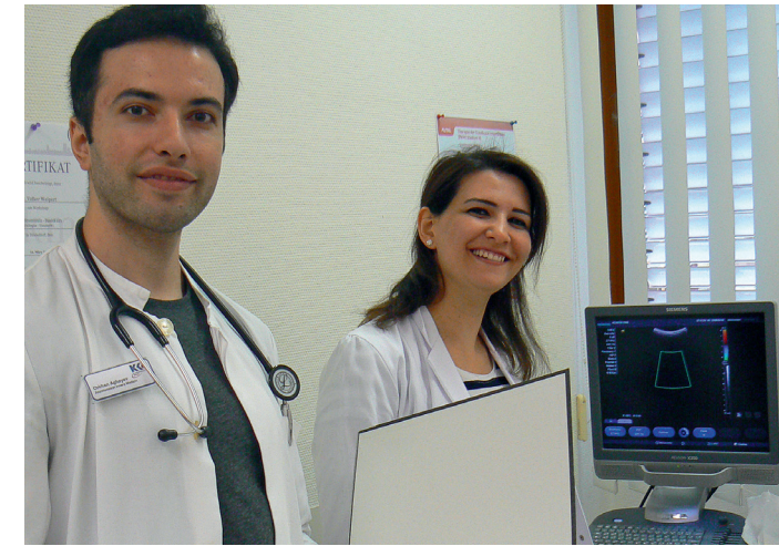
Theorie und Weiterbildungsmaßnahmen direkt am KKH